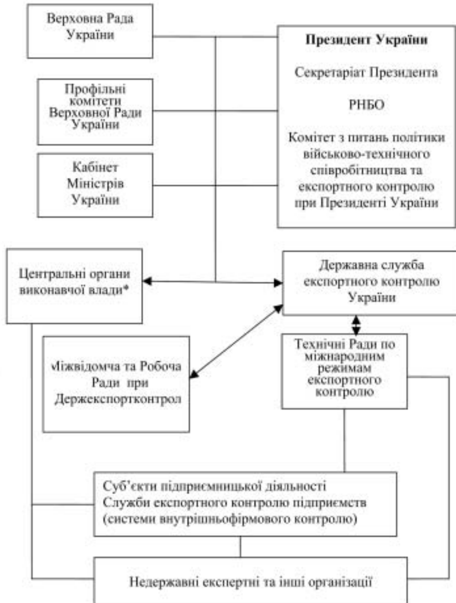
Схема 1. Виконання проектів у рамках Контракту № 2005/73 по удосконаленню експортного контролю України